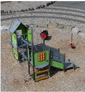
Images d'inspiration représentant des modules de jeux pour enfants

Enfin, les citoyens étaient invités à identifier quel genre de module pour enfant ils préféreraient, d'un point de vue esthétique, parmi les images ci-dessous, en accordant une priorité de 1 à 3 aux propositions qui leur étaient soumises.